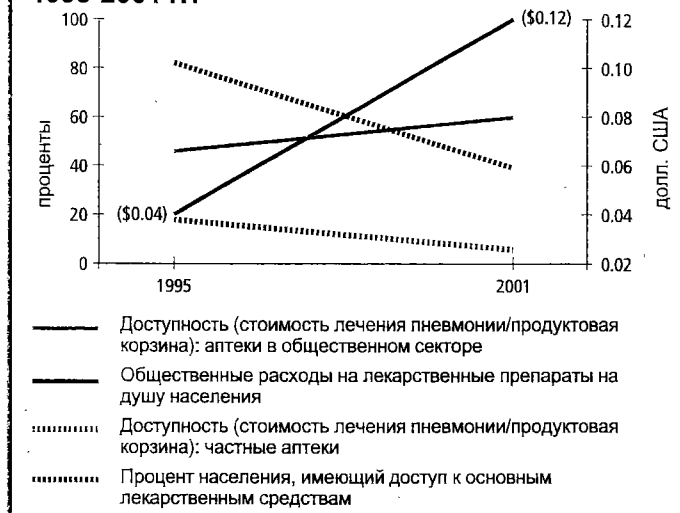
Рисунок 2. Влияние национальной политики в области лекарственных средств в Чаде, 1995-2001 гг.

Воздействие лекарственной политики может проявиться быстро. Например, Чад приняла политику в области лекарственных средств и разработала план ее осуществления в 1995 году. Исходя из результатов основного обследования, осуществленного в то же время, национальная политика в области лекарственных средств и план ее осуществления делают особый акцент на две стратегии по улучшению доступа к основным лекарственным средствам: (1) соответствующий отбор и использование непатентованных лекарственных средств и (2) улучшение поставок лекарственных средств и руководства на основе подготовки, централизованных медицинских складов и оптовых закупок по регионам. За шесть лет этой политикой было оказано значительное воздействие (см. рисунок 2).