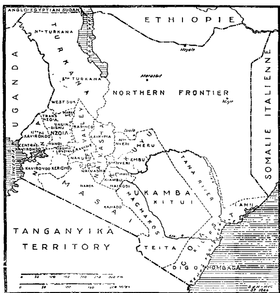
PLAGUE CASES REPORTED IN KENYA IN 1931 AND 1932.