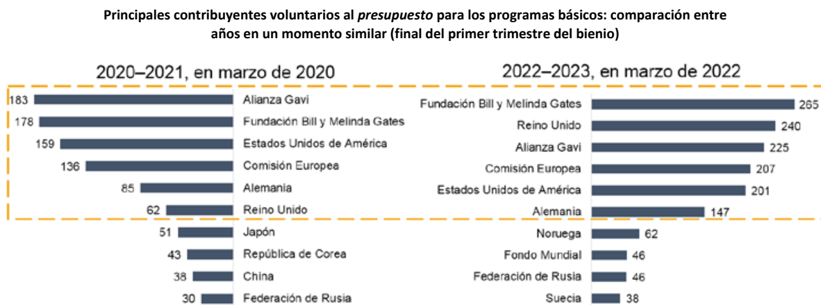
Figura 4. Principales contribuyentes al presupuesto para programas básicos: comparación entre 2020-2021 y 2022-2023