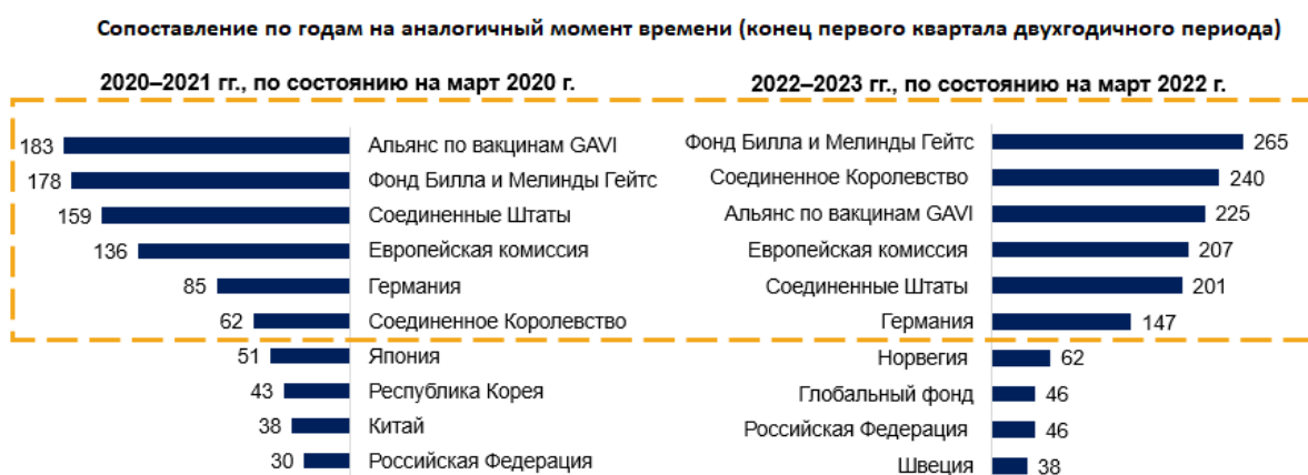
Рисунок 4. Ведущие доноры финансирования базового сегмента бюджета: сопоставление показателей 2020–2021 гг. и 2022–2023 гг.