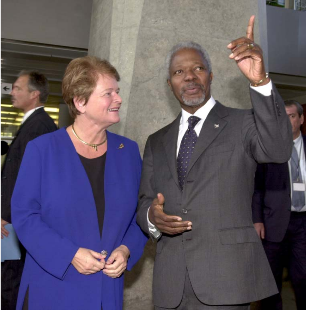
Генеральный директор с Генеральным Секретарем Организации Объединенных Наций во время его посещения штаб-квартиры ВОЗ 2 ноября 2001 г.