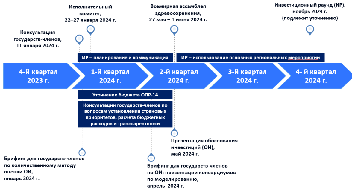
Таблица 3. График проведения мероприятий инвестиционного раунда на период до конца 2024 г.