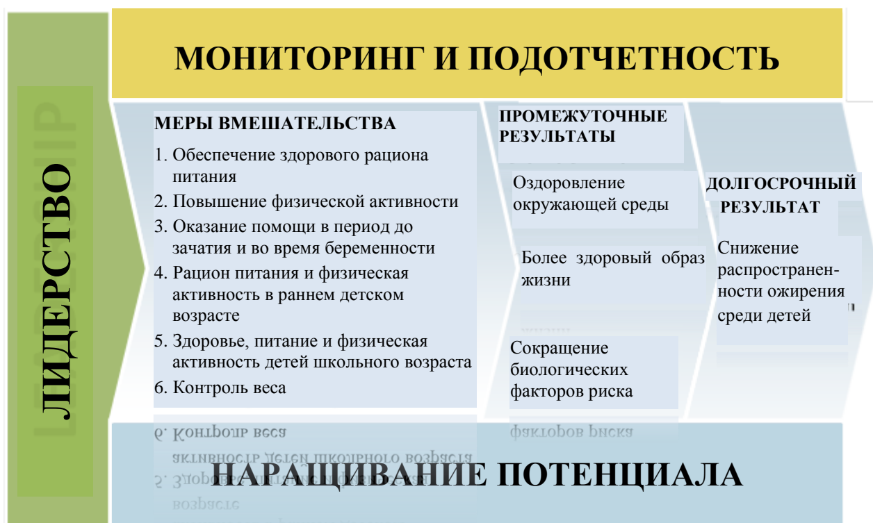
Рисунок 2. Рамочная программа действий для ликвидации детского ожирения

11. В преддверии принятия глобальной стратегии региональные бюро ВОЗ разработали несколько стратегий и планов действий для выполнения некоторых аспектов рекомендаций, представленных ниже 1 . Эти инструменты могут быть интегрированы и, при необходимости, дополнительно усилены путем согласования с рекомендациями Комиссии по ликвидации детского ожирения.