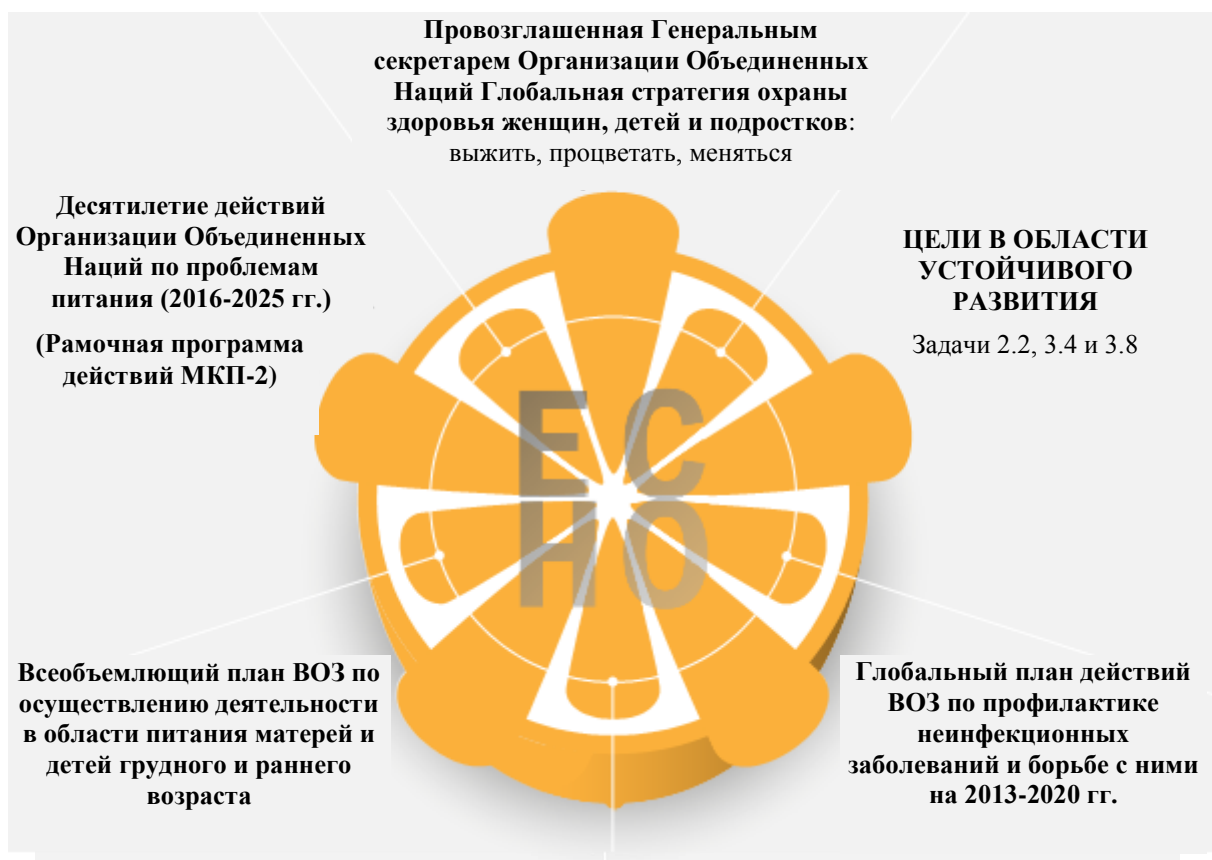
Рисунок 1. Ликвидация детского ожирения способствует осуществлению ряда других стратегий