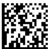
图 2：二维数据矩阵条码的例子