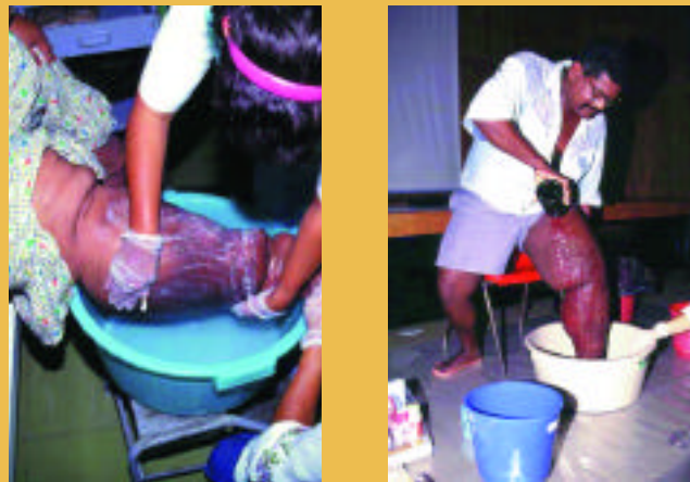
L'OMS préconise des mesures d'hygiène simples pour les parties du corps touchées par l'infection