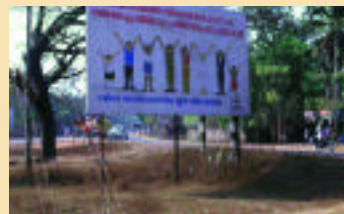
Shertallai, Inde: un panneau publicitaire au bord de la route. 'Ensemble, travaillons à éliminer la FL du Kérala'