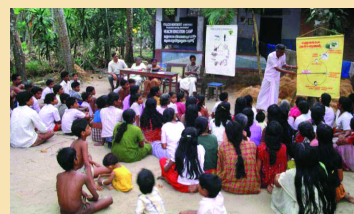
Shertallai, Inde: des organisations bénévoles produisent du matériel éducatif et coordonnent les actions communautaires contre la FL