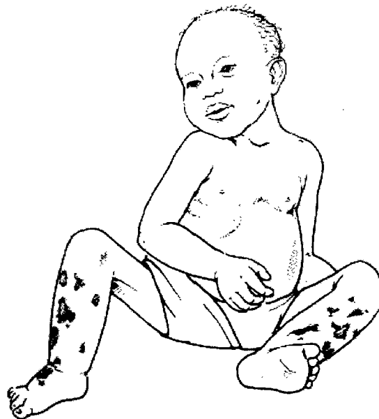
Ребенок с квашиоркором