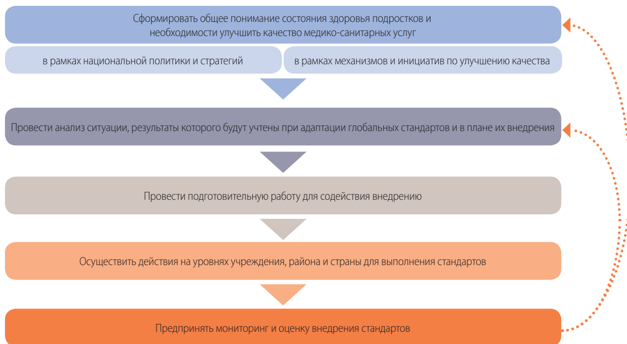
Рис. 1. Шаги процесса внедрения глобальных стандартов