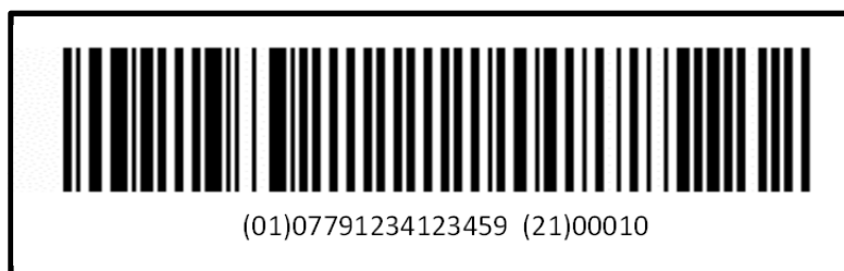
Figura 1: Ejemplo de código de barras lineal