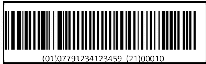
الشكل ١: مثال على الترميز الخطي بالباركود