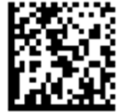
الشكل ٢: مثال على الترميز ذو البعدين بالباركود الحاوي على مصفوفة البيانات