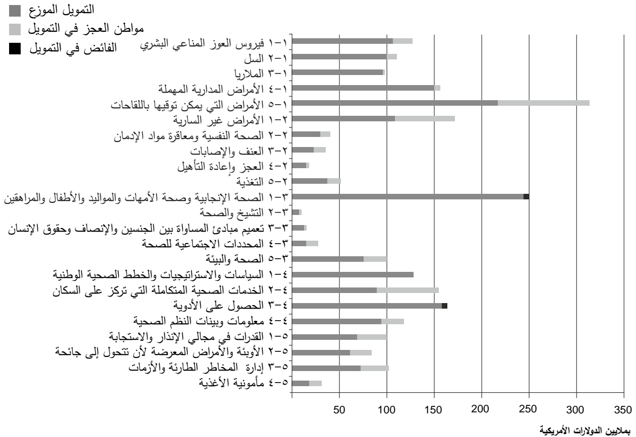
الشكل ١: تمويل الميزانية البرمجية وفقاً لمجال البرنامج في ٣٠ تشرين الثاني/ نوفمبر ٢٠١٤

٥- ومقارنة بالثنائيتين السابقتين، يظهر تمويل الميزانية البرمجية بحسب مجال البرنامج تحسناً بسيطاً. ففي ٣٠ تشرين الثاني/ نوفمبر ٢٠١٤ لم تتجاوز الفجوة في التمويل ٣٣٪ في أية فئة.