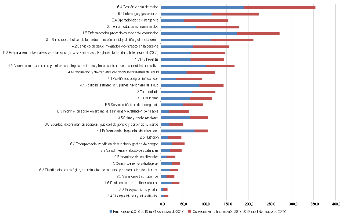
Figura 1. Financiación y carencias de sector programático a 31 de marzo de 2018

9. En la figura 2 se muestra el porcentaje de financiación de sectores programáticos (excepto categoría 6) de contribuciones voluntarias para fines especificados. Diez sectores programáticos reciben el 80% de todas las contribuciones voluntarias para fines especificados. Catorce sectores programáticos reciben menos del 2% de todas las contribuciones voluntarias para fines especificados; eso significa que no consiguen obtener la suficiente financiación voluntaria para fines especificados sostenible, necesaria para lograr los resultados del presupuesto por programas. Además, el grado de contribuciones voluntarias básicas está disminuyendo, por lo que se reduce el nivel de fondos flexibles (contribuciones señaladas, gastos de apoyo a programas y contribuciones voluntarias básicas). Esos fondos juegan un papel catalizador fundamental en la financiación de los programas con fondos insuficientes.