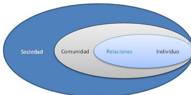
Modelo ecológico para comprender la violencia

Pareja. El término «pareja» hace referencia al marido o compañero con el que se convive, a un novio o amante, un exmarido, una expareja, un exnovio o un examante. La definición de «pareja» varía según el contexto y el estudio de que se trate, y engloba relaciones formales, como el matrimonio, y relaciones informales, como la cohabitación, el noviazgo y las relaciones sexuales extramatrimoniales. En algunos contextos, las parejas tienden a casarse, mientras que en otros son más frecuentes las relaciones informales de pareja. 2