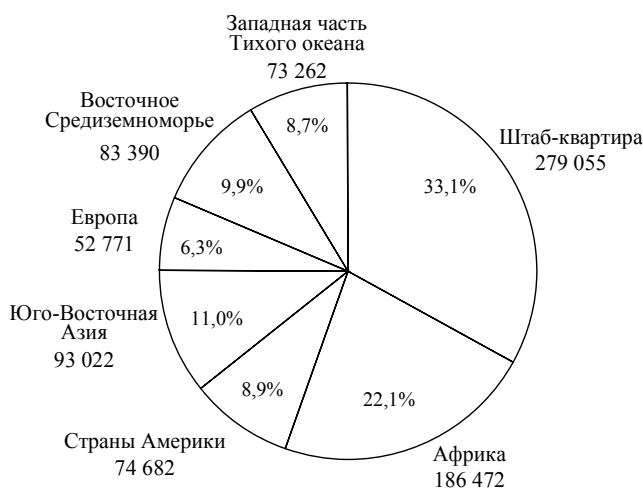
Рисунок 2 - Исполнение регулярного бюджета в соответствии с организационной структурой, 2002-2003 гг. (по состоянию на 31 декабря 2002 г.)